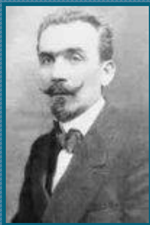
Отляво е снимката на известния български архитект