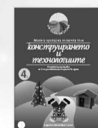
Конструирани и технологии