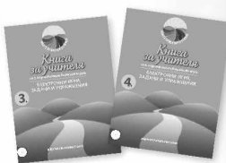
Електронни игри, задачи и упражнения