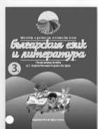
Български език и литература

Нови комплекти познавателни книжки за 3. и 4. подготвителна група